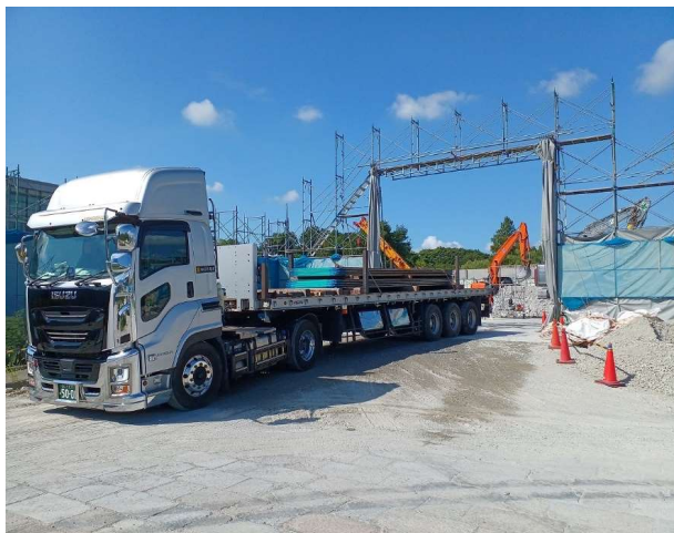
土留め機材・資材搬入